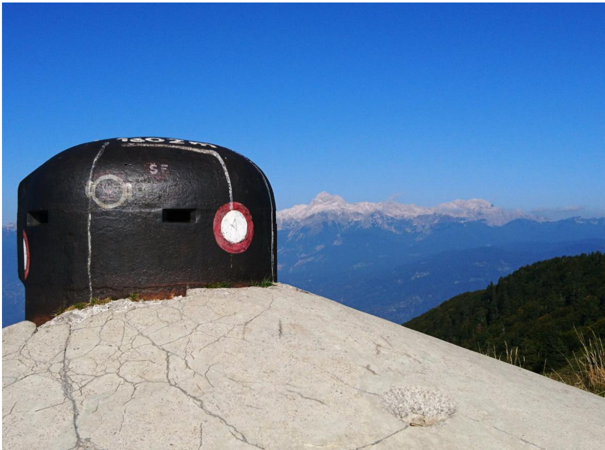
Opazovalnica na Možicu s Triglavom v ozadju.

Z Rapalsko mirovno pogodbo, ki sta jo 12. novembra 1920 podpisali Kraljevina SHS in Kraljevina Italija, je bila določena meja med kraljevinama. Vzdolž meje (od Tromeje do Reke) so leta 1938 začeli z gradnjo sistema utrd, kasneje poimenovanega Rupnikova linija. To ime je dobila po jugoslovanskem generalu slovenskega rodu Leonu Rupniku, ki je bil na čelu štaba za utrjevanje obrambne linije. Zgrajenih je bilo več sto bunkerjev, med njimi tudi trije podzemni obrambni bloki, t.j. Hlavče njive, Hrastov grič in Goli vrh, ki so bili strateško ključnega pomena za obrambo pred morebitnimi vdori italijanskih vojakov na ozemlje SHS. Med temi velikimi objekti so gradili manjše protipehotne bunkerje za dva do sedem vojakov. Med objekti so napeljali bodečo žico, v dolinah pa postavili tudi protitankovske ovire. Ob začetku 2. svetovne vojne so vsa dela na obrambni liniji takoj prenehala in veliko objektov je ostalo nedokončanih. Obrambna linija ni nikoli služila svojemu namenu.