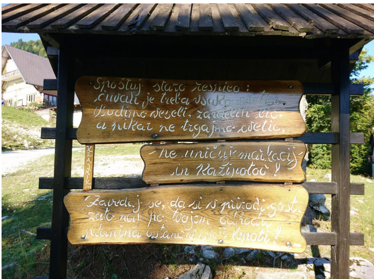
Nekateri napisano poznamo in se tega zavedamo, drugi pa ...