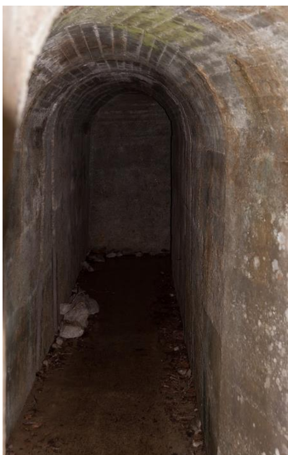
Vhoda v podzemlje.