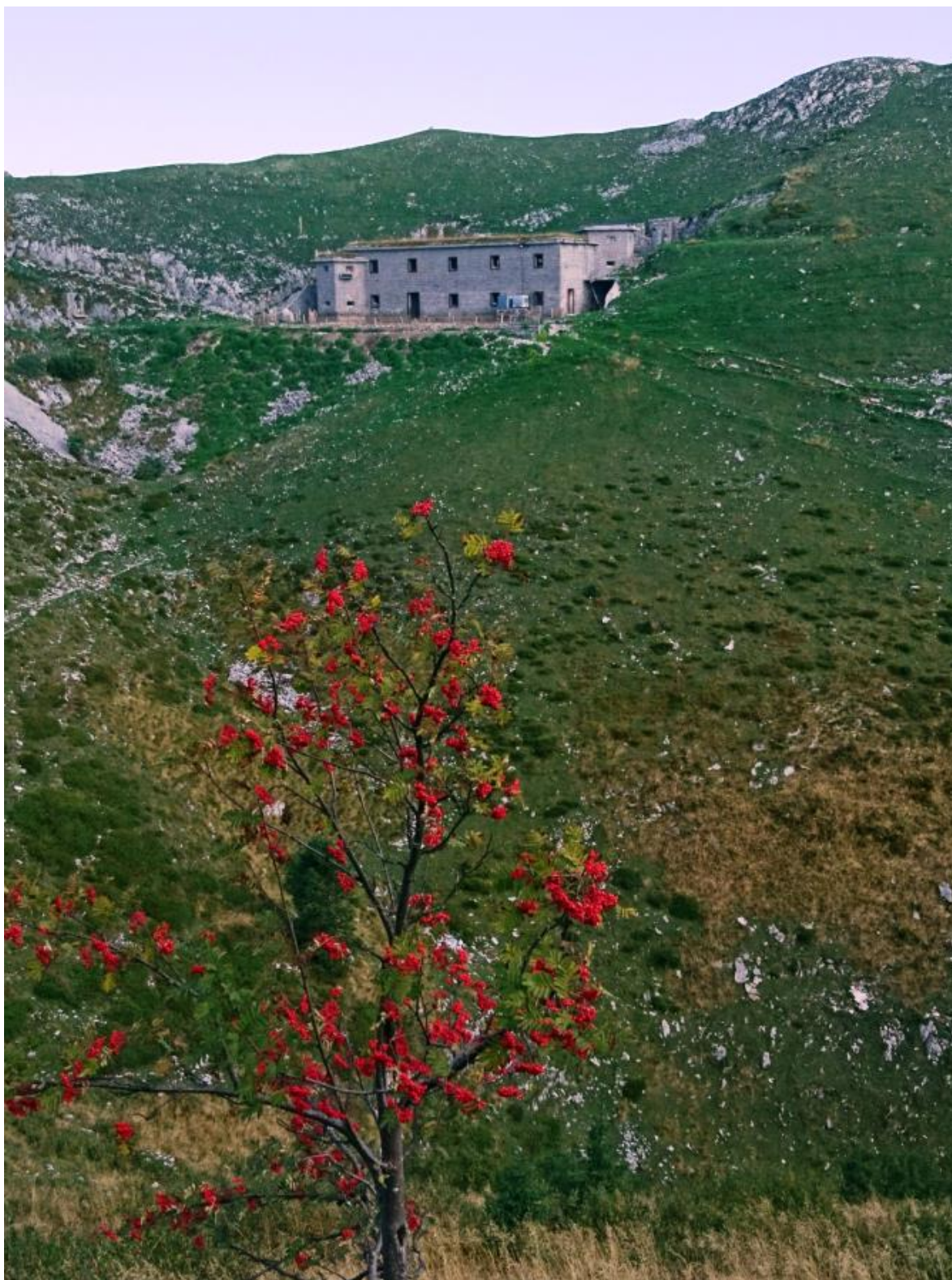
Kasarna je sedaj štala za ovce in skromno bivališče za pastirja.