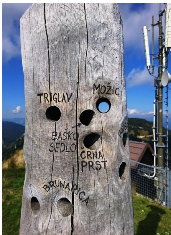
Inovativen razgledni steber; vsaka luknja ima pogled na napisano točko.