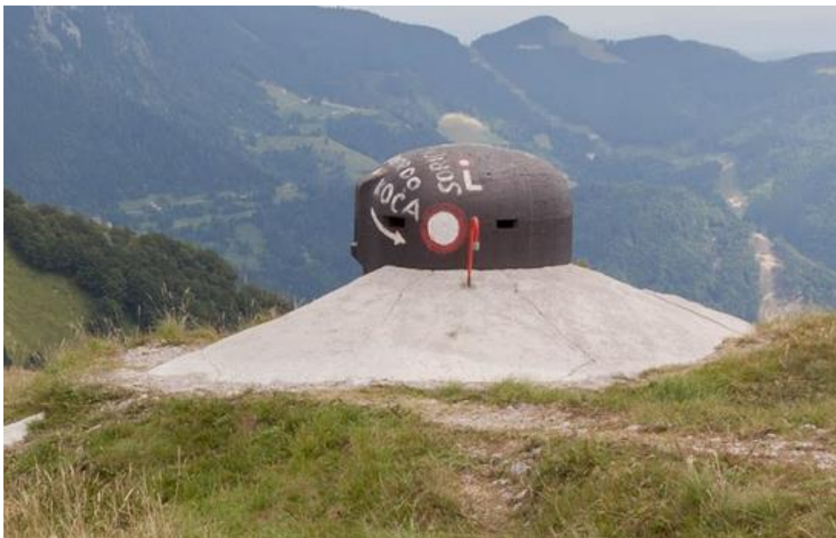
Opazovalna kupola na Lajnarju