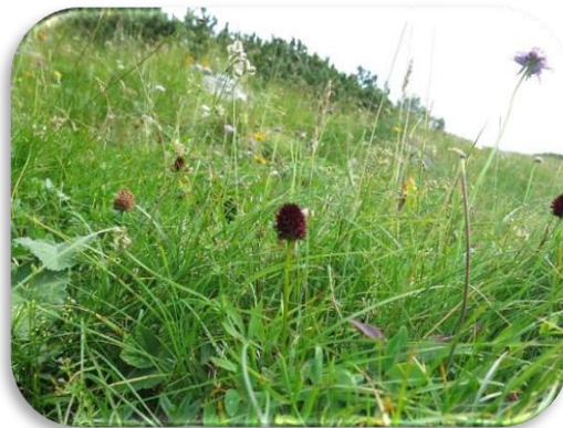
Prečudovito cvetje na Ogradih